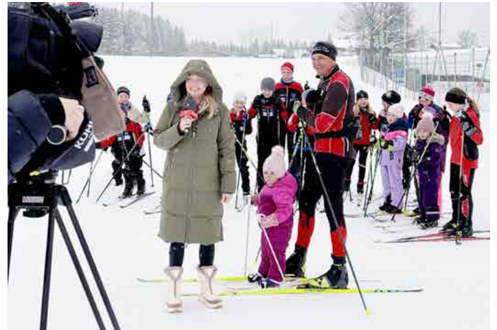
Besuch des ORF im Langlaufzentrum - ORF Wetter Angerberg

Wir bedanken uns herzlich bei allen Loipengrundbesitzer*innen, die es jedes Jahr ermöglichen, Loipen für unsere Gäste und Einheimischen zu spuren. Der Tourismusverband wird auch weiterhin alles daransetzen, dieses Angebot in bestmöglicher Qualität bereitzustellen – damit wir auch künftig mit großem Stolz auf ein hervorragend gepflegtes und attraktives Langlaufgebiet verweisen können.