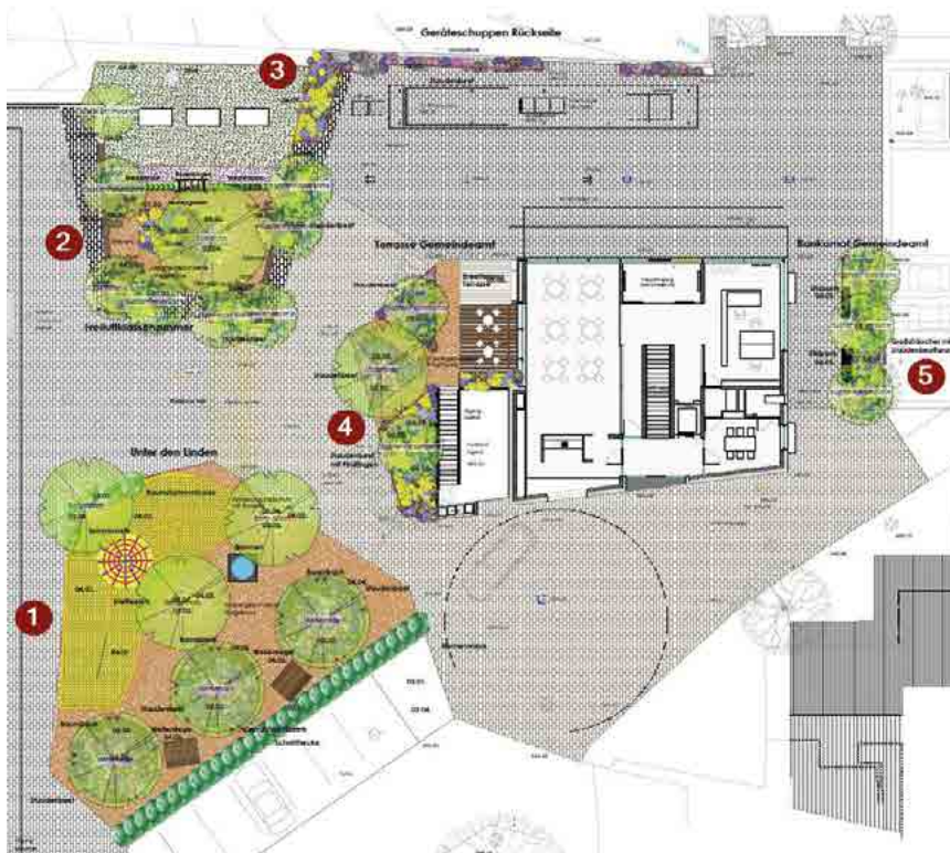
Unter den Linden