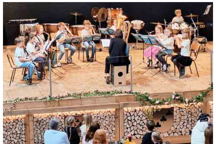
Die Bläserklasse der VS Angerberg bei der Muttertagsfeier